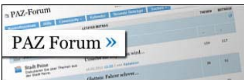
BILD DER WOCHE